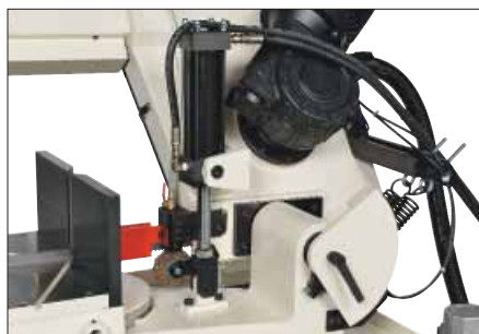
Механизм подъема рамы